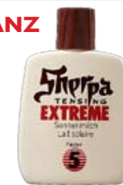
Klassiker So sah die Verpackung jahrzehntelang aus.